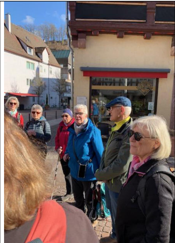
Start in Calw