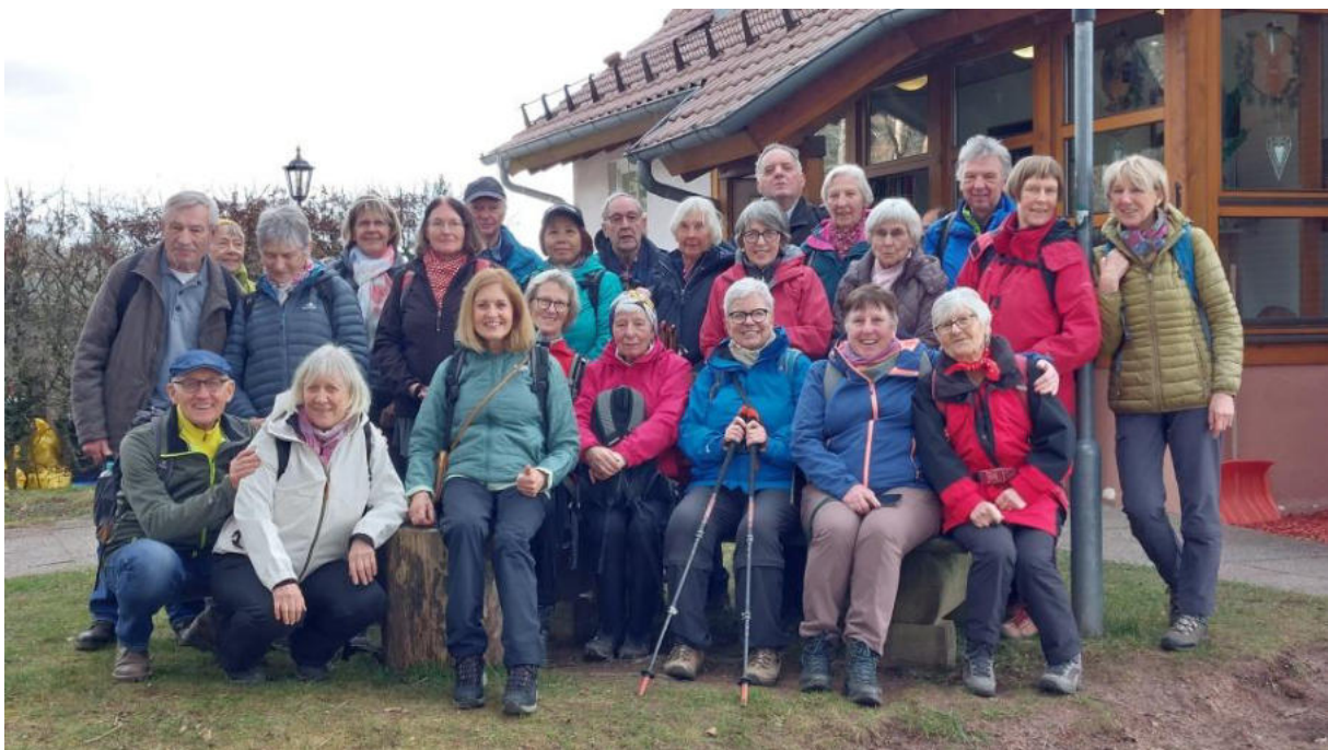
und nochmal – alle –