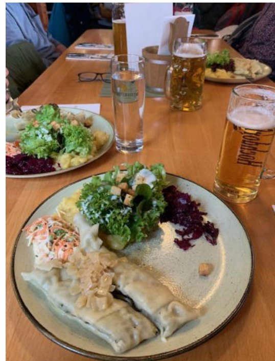
..endlich was zu essen..