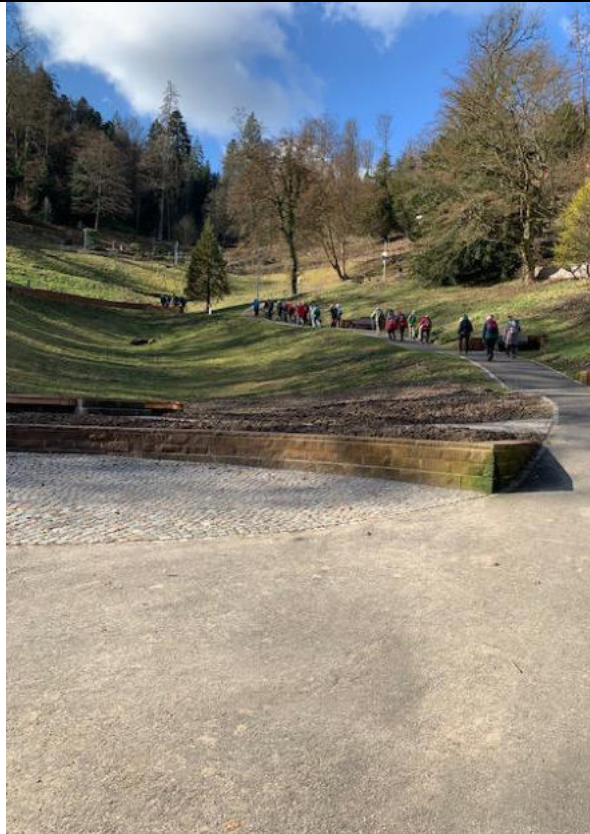
Zum Aufstieg zu den..