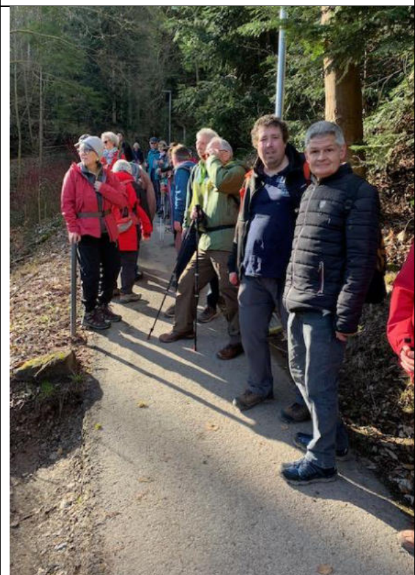
Aufstieg von Calw